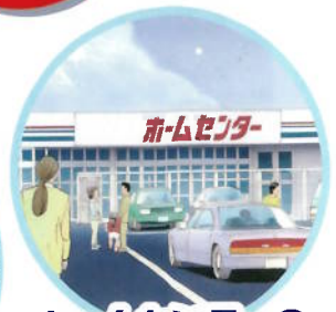
ホームセンターの 一角 など など…