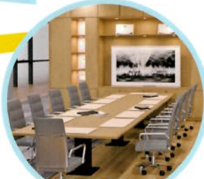
コンサルティング 会社の空きスペース