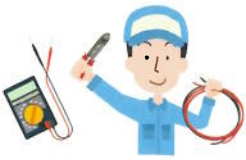
電気設備・通信設備工事費