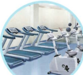
スポーツジムの 一角