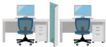
パーティション等の設置費