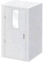
簡易型 テレワーク用ブース