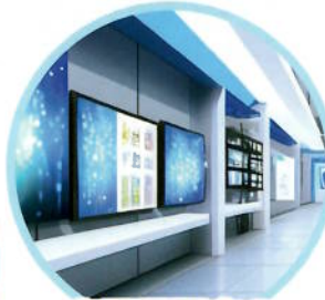
家電量販店の 一角